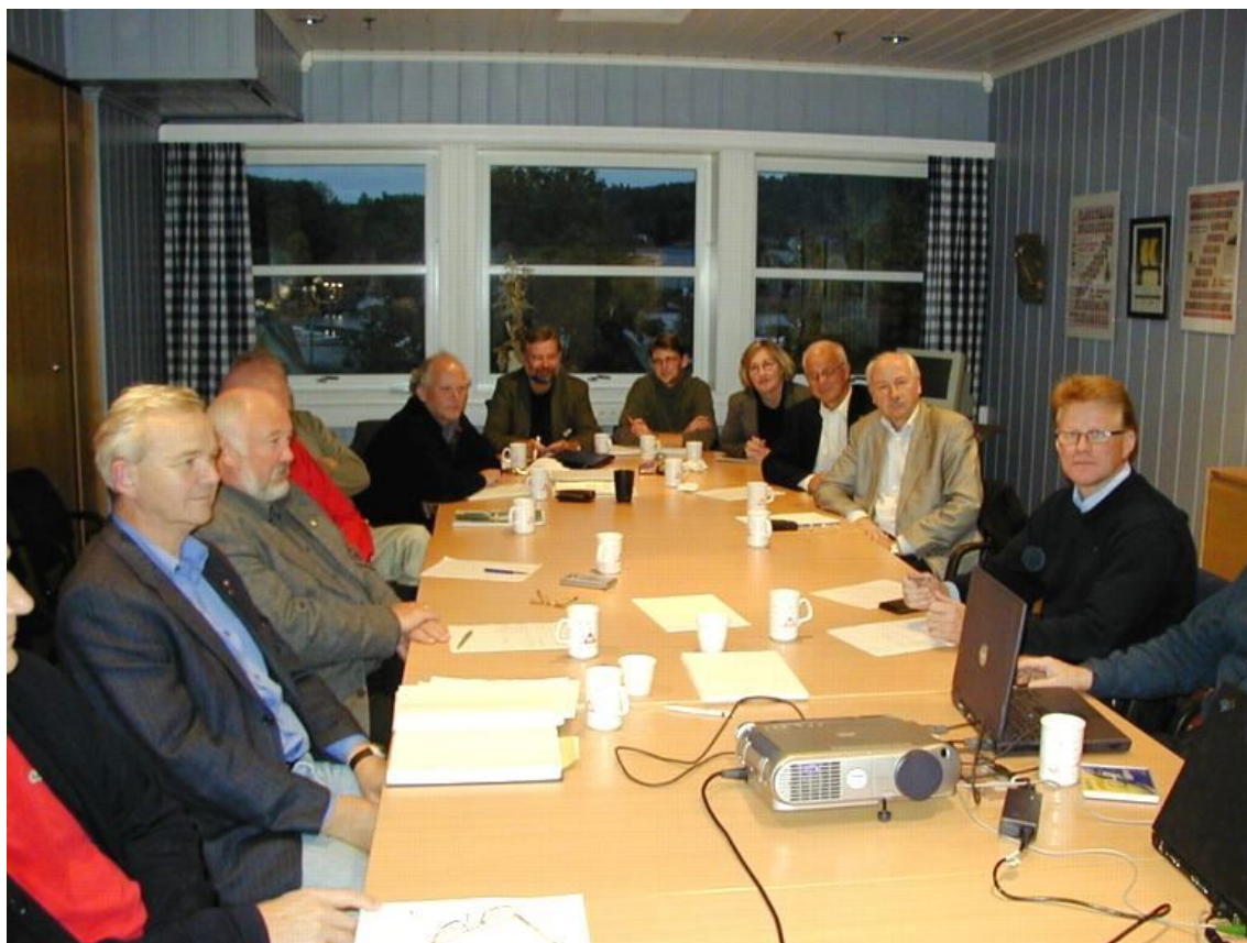
Det var god deltagelse av presidenter og IT-ansvarlige på seminaret i Tønsberg