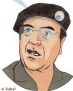
Mohammed Saeed al-Sahaf Tidligere irakisk informasjonsminister

I Rotaryåret 2003 - 2004 vil alle klubbsekretærer i D 2290, som en naturlig og kjærkommen håndrekning til vår Distriktssekretær, sende ham sin klubbs månedlige fremmøterapport innen den 5. i etterfølgende måned.