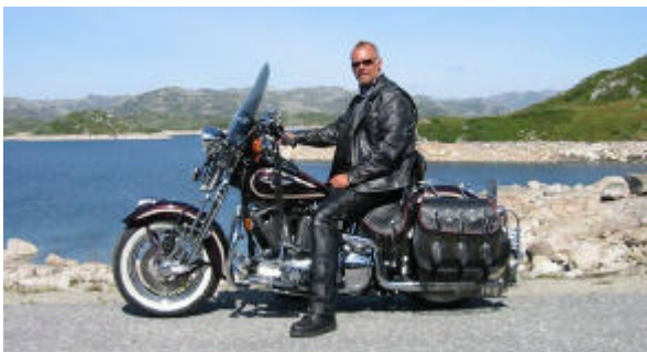
President Torstein på sin flotte sykkel

Det må nok brukes både gulrot og pisk for å få opp fremmøte og aktivitetene i mange klubber. Herved inviteres leserne til å dele erfaringer og ideer i neste kvartalsbrev.