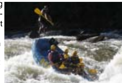
Vi er med på mange aktiviteter

Men jeg tilbringer et år i USA som GRSP student for mer enn bare studiene sin skyld. Jeg er nemlig ute etter å oppleve den amerikanske kulturen til det fulle, og tar med meg hver eneste opplevelse jeg kan få med meg. Jeg har det virkelig som "plommen i egget". Blant annet har jeg dykket i Florida, vært