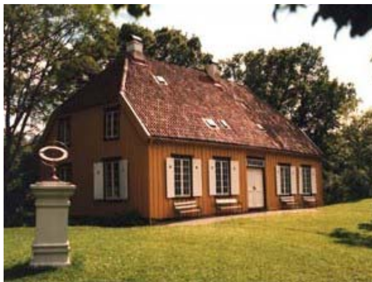
Les mer om Berg Museum på nedenstående webside http://www.telemark.museum.no/default.htm

Det arbeides med et vannprosjekt sammen med klubben på Notodden men siden Kenya var det tiltenkte landet er