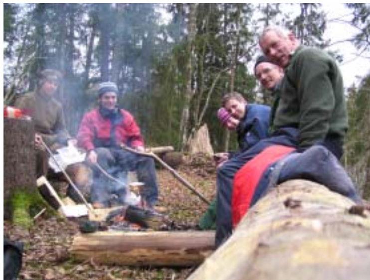
Et gladbilde fra Prosjekt Sandsletta.

En gruppe jobber med en rotarytur til Brasil. En av våre medlemmer bor halve året der. Vi har begynt forberedelsene i klubben med både besøk fra Brasil og foredrag.