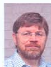
Per Magen Berget It-tjeneste (DICO)