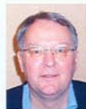
Stein Graf Ungdoms- utveksling