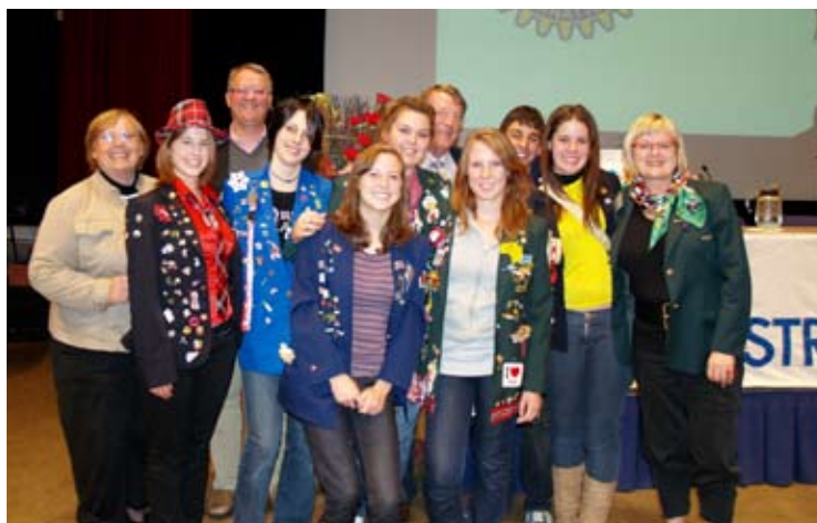
Studenter 2007/2008 sammen med nasjonale ledere for ungdomsutveksling og D YEO, alle fra D 2290

Regnskapet for Ungdomsutveksling skal etter Distriktsrådets vedtak integreres i konsernregnskap for D 2290 fra og med rotaryåret 2008/2009