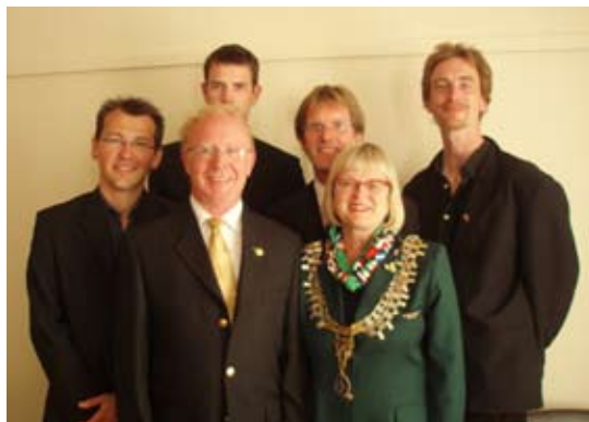
Distriktsguvernør besøker innkommende team fra D 1530 i Ulefoss RK

Vi tok imot det franske teamet nesten to måneder senere og møtte fem personer med store forventninger til uker som gjester i Distriktet. Det var klubbene Re, Sem, Ulefoss, Grøm og Kristiansand Vest som skulle være vertskap i litt under en uke hver. De var alle godt forberedt og gjennomførte besøket på en god måte. Tilbakemeldingene fra Frankrike har bare vært av de beste.