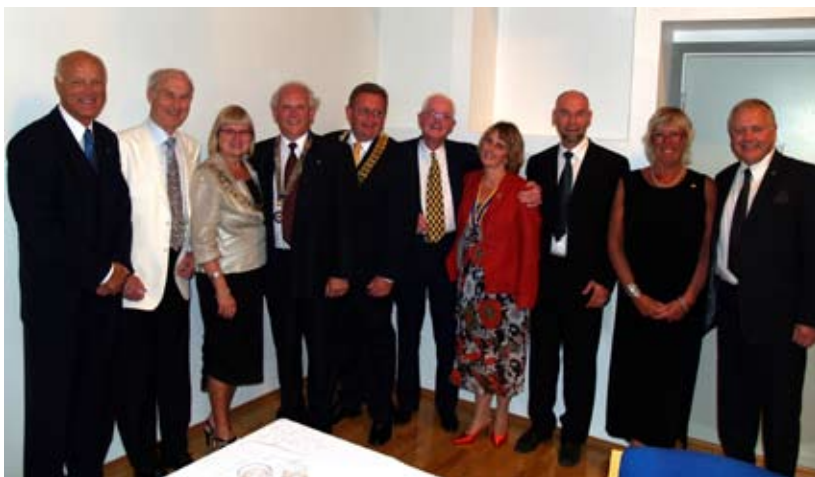
Stokke RK 50 år - Presidenter og AG i Vestfoldklubber

Guvernøren er imponert over de staselige jubileumsfeiringene med feiende flotte fester og innholdsrike jubileumsskrifter som er viktige for klubbens historie.