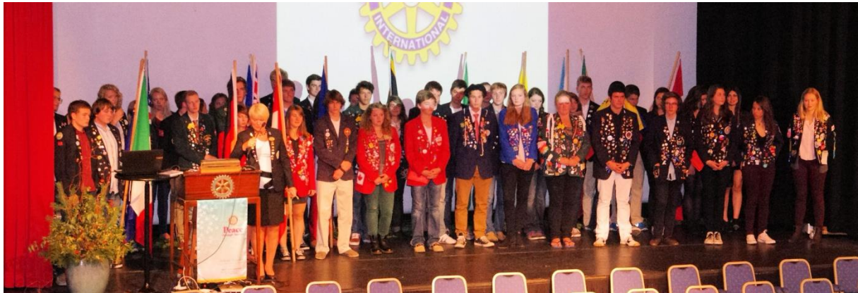
Uttevkslingsungdom fra hele landet samlet under distriktskonferansen i Sandefjord.

Samarbeidet internt med Guvernør og distriktsorganisasjonen har vært støttende og til god inspirasjon.