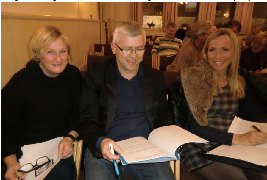
Sertifiseringskurs i Kristiansand

I forbindelse med overgang til ny ordning ble det avholdt høstkurs i Tønsberg og Kristiansand med god deltakelse. I mars 2013 hadde vi sertifiseringskurs i Sandefjord, Kristiansand og på Stathelle. Komiteens medlemmer har deltatt på kursene. Det var over 100 deltakere på sertifiseringskursene, og over 30 klubber ble sertifisert. I tillegg har DRFC hatt flere klubbmøter med den nye ordning som tema. Også disse møtene har hatt god deltakelse. Det har også vært opplæring i ny modell på PETS, innen AG-område og på årets ledersamling. Distriktets klubber er i god rute og klar til å støtte fondet, og bidra til å bruke det nye systemet.