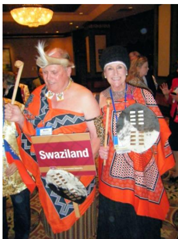
Internasjonalt møte – guvernørkolleger fra Swaziland i full mundur!