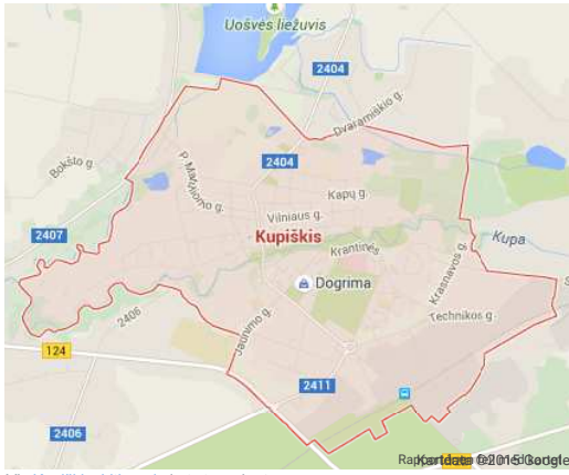
Vis Kupiškis, Lithuania i et større kart