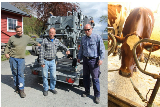
Bilde av Dagros og ein Klauvskjerar maskin

Då Dagros såg denne, la ho på svøm 600 meter ut fjorden. Eg trudde aldri me skulle sjå henne att.