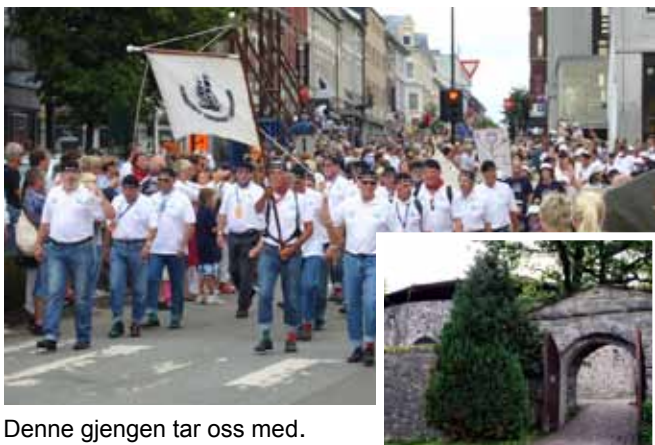
Denne gjengen tar oss med.

Ship O-hoy er festens motto på festningen fredag kveld. Dette er jo måten å ønske velkommen fra et maritimt ståsted. Maritimt skal det bli både når det gjelder mat og underholdning. Gled deg til et herlig sørlandsk måltid, med innslag av verbal og musikalsk underholdning.